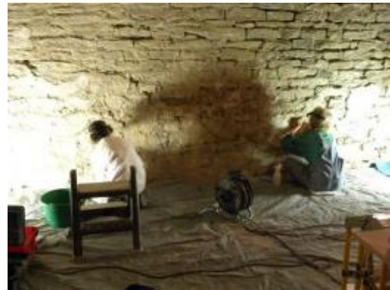
Au travail sur les fresques... Venez les voir sur place !